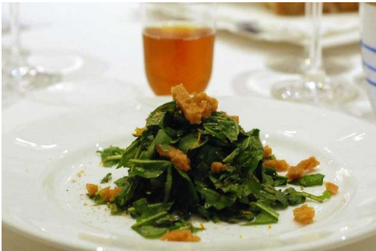
Insalatina di cicoriotta di campo, pane, fava tonka e shot di birra Patty