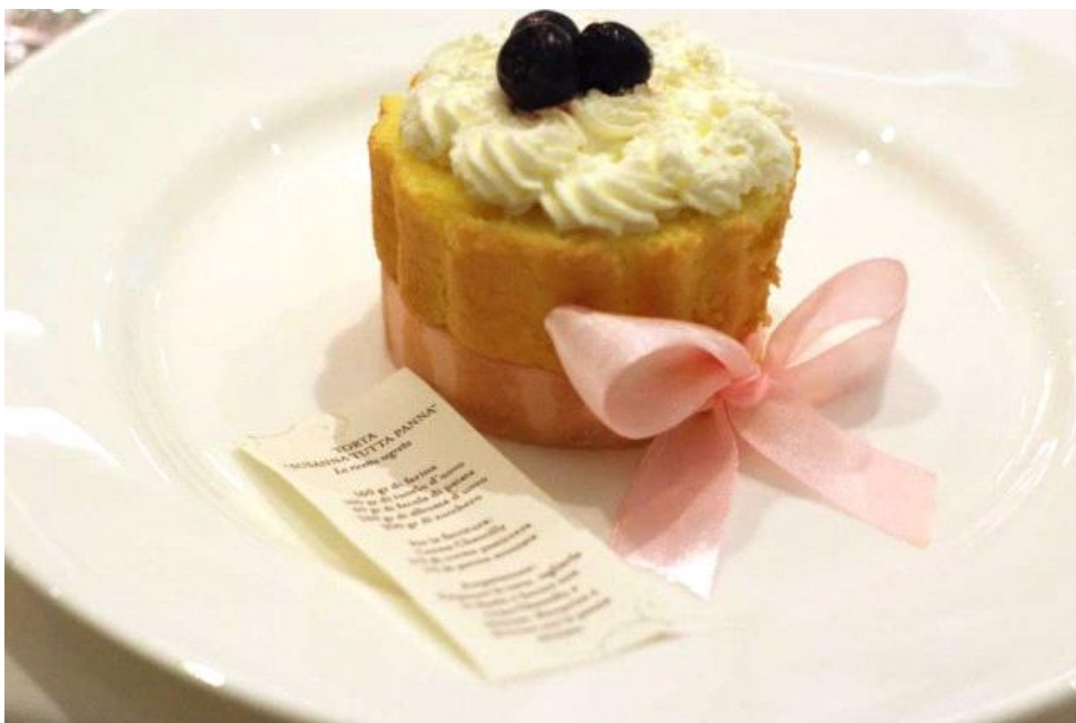
Charlotte all'amarena con una sorpresa in "allegato": la ricetta della torta Susanna tutta panna.

Risate e affetto, commozione e ammirazione: tante erano le emozioni ad accompagnare la serata dedicata a Nino Manfredi, attore, regista, scrittore, doppiatore, sceneggiatore e cantante, insomma, un grande artista italiano che ha lasciato traccia in ognuno di noi.