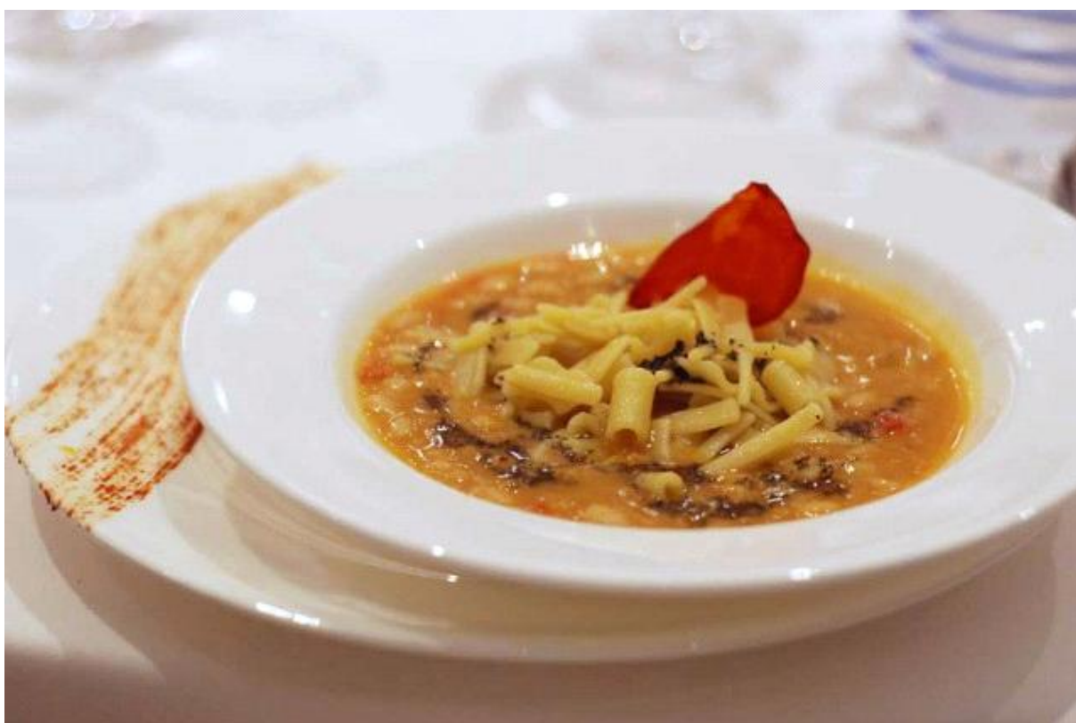
Pasta mista con cotiche e fagioli del purgatorio (indubbiamente, il piatto migliore della serata)