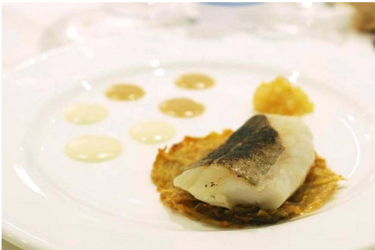
Filetto di baccalà laccato al miele arso di castagno su rosti di patate con salsa aioli, emulsione al caffè e composta di limone